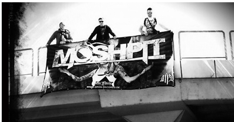
«Moshpiti Release Party», Γερμανία, 28 Απριλίου 2012

Σας ευχαριστούμε πολύ για το ενδιαφέρον σας, και με τις καλύτερες ευχές μας για ό,τι κάνετε στο μέλλον, σας παραθέτουμε ένα απόσπασμα από τους στίχους της νέας μας δουλειάς: "Do it for yourself / not to assume some role / believed to be a revolution / but to most is just a style / step back / reconsider your position / step back and try to deal in something real / I'm not turning back to the vow I made to my soul / to shut out and segregate was not the original intent / it seems we've lost sight of what it once meant / it's not a question of worth but its worth questioning ..."