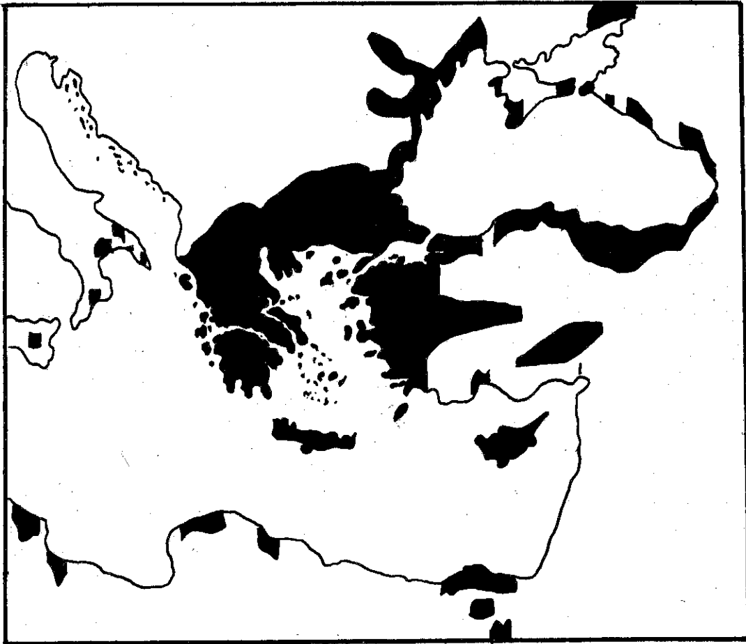
ΤΑ ΟΡΙΑ ΤΗΣ ΕΛΛΗΝΙΚΗΣ ΕΠΙΚΡΑΤΕΙΑΣ ΤΟ 1875

Ἡ Μεγάλη Ἰδέα, τὸ ὄνειρο τοῦ Ἑλληνισμοῦ γιὰ τὴν ἐπανάκτηση τῶν χαμένων ἐδαφῶν, τὴν ἀπελευθέρωση τῶν ἀλύτρωτων Πατρίδων, δὲν χάθηκε ὅπως ἔντονα ὑποστηρίζουν οἱ θιασῶτες τῆς ἀστικῆς διανόησης. Σὲ πείσμα τῶν συμφερόντων ὧσων προσπαθοῦν νὰ τὴν ἀποσιωπήσουν, ἡ Μεγάλη Ἰδέα ζεῖ. Ζεῖ μέσα στὶς καρδιές τῶν Πατριωτῶν, ἀτόφια, δυνατή, ἐλπιδοφόρα. Φεγγοβολᾷ τὸς δραματισμούς μας καὶ διευρύνει τὶς ἐλπίδες γιὰ τὴν ἀναγέννηση τοῦ ἔθνους.