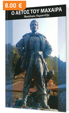
«Ο ΑΕΤΟΣ ΤΟΥ ΜΑΧΑΙΡΑ» του Ν. Λεμοντζή