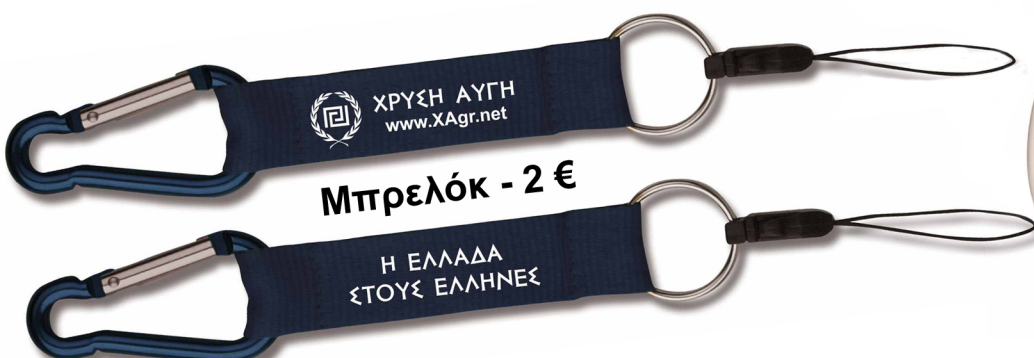
Μπρελόκ - 2 €