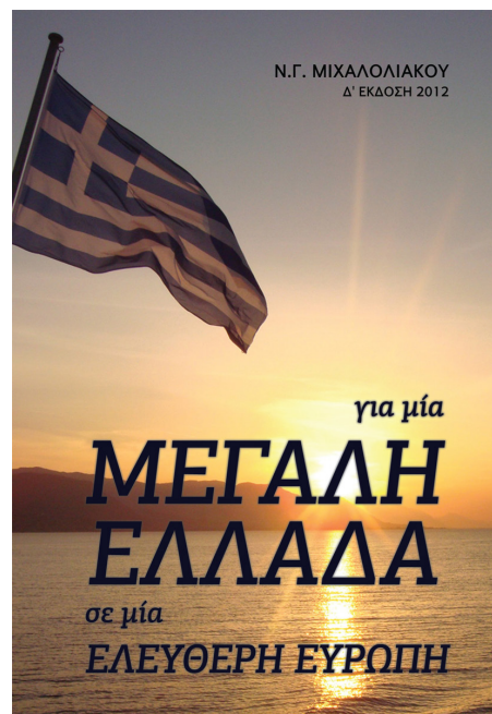
ΓΙΑ ΜΙΑ ΜΕΓΑΛΗ ΕΛΛΑΔΑ ΣΕ ΜΙΑ ΕΛΕΥΘΕΡΗ ΕΥΡΩΠΗ