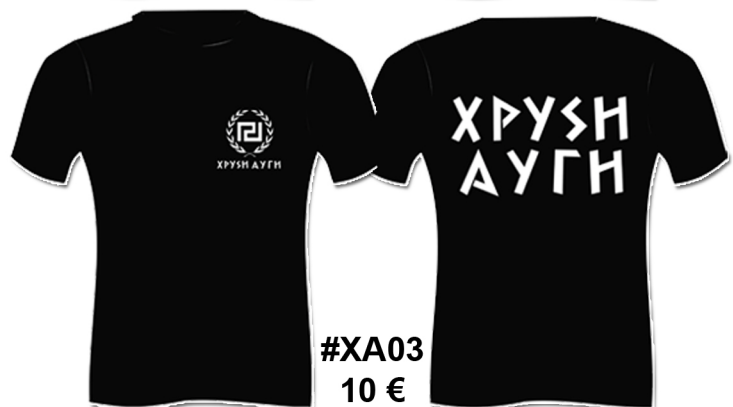
#XA03 10 €