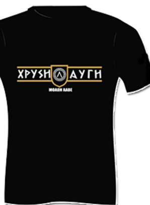
#XA06 10 €