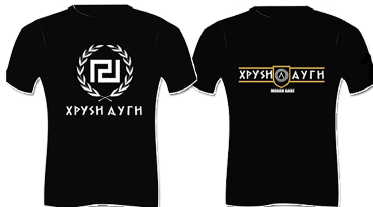
#XA05 10 €