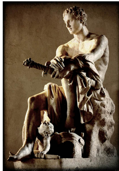
ΤΕΥΧΟΣ 1 • ΕΘΝΙΚΙΣΤΙΚΗ ΙΔΕΟΛΟΓΙΚΗ ΕΠΙΘΕΩΡΗΣΗ