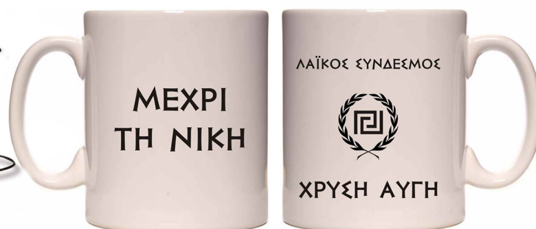
Κούπα - 5 €

ΠΑΡΑΓΓΕΛΙΕΣ στα τηλέφωνα 210-5152711 και 6980564835.