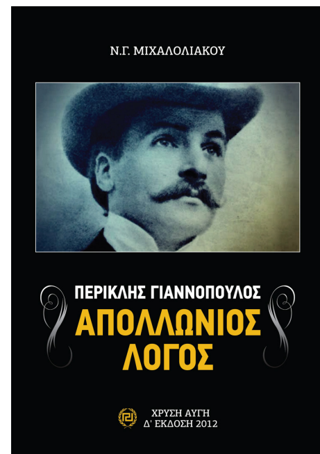
ΠΕΡΙΚΛΗΣ ΓΙΑΝΝΟΠΟΥΛΟΣ Ο ΑΠΟΛΛΩΝΙΟΣ ΛΟΓΟΣ