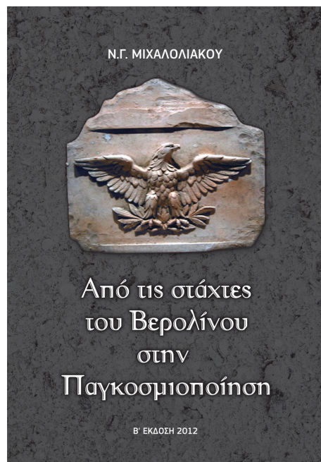
ΑΠΟ ΤΙΣ ΣΤΑΧΤΕΣ ΤΟΥ ΒΕΡΟΛΙΝΟΥ ΣΤΗΝ ΠΑΓΚΟΣΜΙΟΠΟΙΗΣΗ