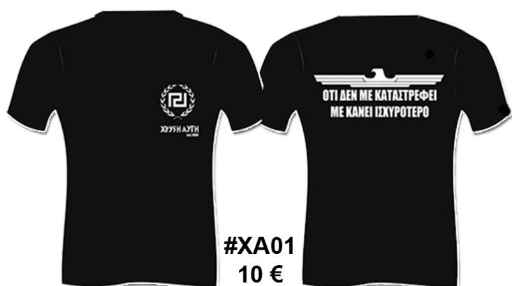
#XA01 10 €