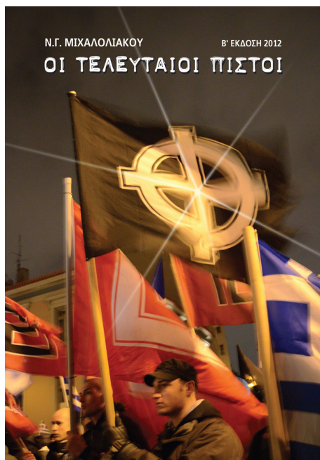
ΟΙ ΤΕΛΕΥΤΑΙΟΙ ΠΙΣΤΟΙ