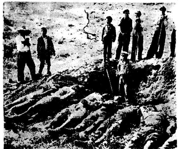
Εις εκ των χιλιάδων όμοδικών τάφων άθών Έλλήνων πατριωτών. Ήσαν μήπως κεφαλοιοκράται; Όχι ήσαν όλίγα από τας χιλιάδας των άνωνύμων θυμάτων της βαρβαρότητος του σλαυισμού.