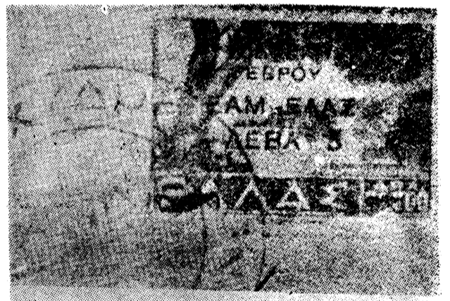
Και την δραχμήν ακόμη άντικατέστησε το ΕΑΜ με το βουλγαρικόν λέβα. Δέν έπρεπε να ύπάρχη τίποτε που να θυμίζει Ελλάδα και Έλληνισμόν.

Πολεμούμεν τόν κομμουνισμόν, διότι ο κομμουνισμός είναι προδοτικός. Ίδιαιτέρως δέ ο έγχώριος μπολσεβικισμός μισεί την Ελλάδα με ένα παράφορο μίσος, που κομμάι λογική δέν δύναται να έξηγήση. Άγωνίζεται ο κομμουνισμός παντού, πάντοτε και με όλη την δύναμι της μοχθηρῆς ψυχῆς του, δια τόν άφρανισμόν της Έλληνικής φυλής. Η έξόντωσις του Έλληνισμού που άποτελεί προαιώνιον έπιδίωξιν του σλαυισμού, άντετέθη από την Διεθνή του μαρξισμού εις το Κ.Κ.Ε., το όποιον έξαπέλυσε φονικωτάτους πολέμους εναντίον του έθνους. Άλλά δέν ένίκησε. Το ελληνικόν πνεύμα και η ελληνική ψυχή συνέτριψαν τας σκοτεινάς δυνάμεις της βίας και του έφιαλτισμού.