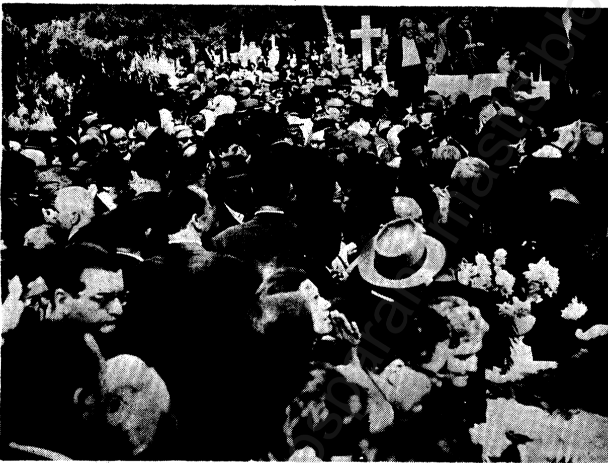
Χιλιάδες λαού είχαν καλύψει όλους τους χώρους περίξ του Τάφου του άειμνήστου Αρχηγού

Εμπνευσμένος και διάπυρος ό λόγος του Κωνστ. Μανιαδάκη