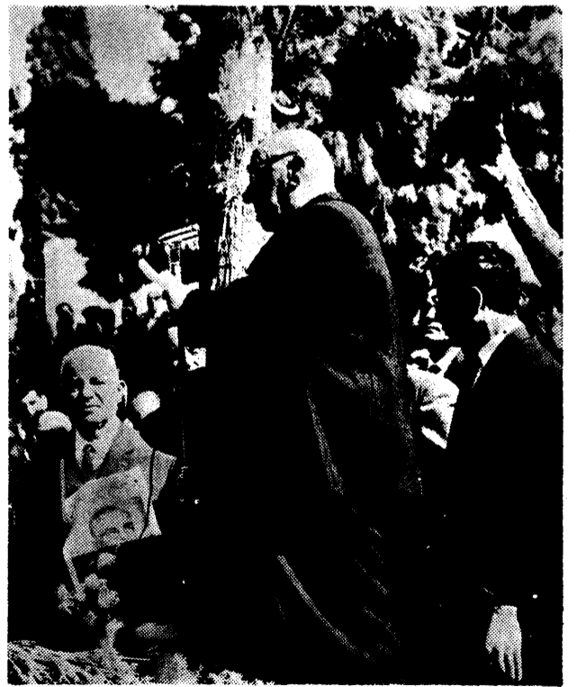
Ο Υπουργός Ασφαλείας τής 4ης Αύγουστου Κωνσταντίνος Μανιαδάκης όμιλόν πρό του Τάφου του Ιωάννου Μεταξά.

«Τό 1940 ό Μουσσολίνι έπέλεξε τήν ήμέραν τής 28ης Οκτωβρίου, έπέτειον τής θριαμβευτικής πορείας του Φασισμού πρός τήν Ρώμη, διά νά σου στείλη, άθάνατε Μεταξά, τόν Γκράτσι και νά σου ζητήση τήν έντός τριών ώρών παράδοσιν άμαχητί τής Έλλάδος, διότι έπεθύμει και έπίστευεν ότι θα προ-