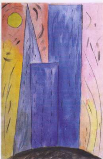
ABRAHAM WALKOWITZ (1880-1965), ΣΠΟΥΔΗ ΣΤΟΥΣ ΟΥΡΑΝΟΞΥΣΤΕΣ

33. "Biographies, 2002 Socialist Scholars Conference," www.socialistscholar.org/biographies .