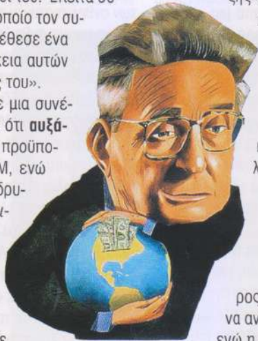
ΑΠΟ ΤΟ ΤΙΜΕ 01/09/1997

Εκείνη τη στιγμή, ένα πρόσωπο, υψηλά ιστάμενο στην κυβέρνηση Κλίντον, μου είπε ότι ο Σόρος μεγιστοποίησε τις προσπάθειές του: «Έγραψε μια αιχμηρή επιστολή στον πρόεδρο, παραλληλίζοντας την πολιτική του με εκείνη του κατευνασμού που επέδειξαν οι Δυτικές Δυνάμεις έναντι της Γερμανίας το 1938», μου είπε το πρόσωπο αυτό. [...] Σε δημόσιες εμφανίσεις του κατήγγελλε την Ελλάδα και το ελληνοαμερικανικό λόμπι. Ακούσε πίεση στον Στρόμππ Τάλμποτ και σε άλλα στελέχη του Στέιτ Νηπάρτμεντ και του Εθνικού Συμβουλίου Ασφαλείας. Στις συναντήσεις του Μπρέτον-Γουντς, στην Ουάσιγκτον, τον περασμένο Ιούλιο, ο Σόρος δούλεψε με επιμονή παρασηκηνικά, προσπαθώντας να πείσει κάποια μέλη της Ευρωπαϊκής Ένωσης να βοηθήσουν την Π.Γ.Δ.Μ. (Η Ελλάδα, που κατείχε τότε την προεδρία της Ένωσης, έθεσε βέτο σε κάθε τέ-