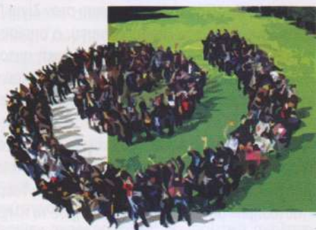
ΑΝΑΠΑΡΑΣΤΑΣΗ ΤΟΥ ΣΗΜΑΤΟΣ ΤΟΥ ΙΔΡΥΜΑΤΟΣ ΣΟΡΟΣ

« ΝΑΙ, ΔΙΑΘΕΤΩ ΕΞΩΤΕΡΙΚΗ ΠΟΛΙΤΙΚΗ ... ο σκοπός μου είναι να γίνω η συνείδηση του πλανήτη». Δεν πρόκειται για μια περίπτωση ναρκισσιστικής διαταραχής· αφορά το πώς ο Τζωρτζ Σόρος επιβεβαιώνει το κύρος της ηγεμονίας των Ηνωμένων Πολιτειών επάνω στον σημερινό κόσμο. Τα ιδρύματα και οι οικονομικοί μηχανισμοί του Σόρος είναι εν μέρει υπεύθυνα για την πτώση των καθεστώτων στην Ανατολική Ευρώπη και την πρώην Σοβιετική Ένωση. Τα ίδια δίκτυα έχουν απλώσει τα πλοκάμια τους στην Κίνα. Ο Σόρος έπαιξε επίσης καθοριστικό ρόλο στη διάλυση της Γιουγκοσλαβίας. Ο ρόλος του αυτοαποκαλούμενου και ως «φιланθρωπού» είναι να ενισχύει τις ιδεολογικές εκφράσεις της παγκοσμιοποίησης και της Νέας Τάξης Πραγμάτων προωθώντας παράλληλα το οικονομικό του συμφέρον. Οι εμπορικές και «φιλανθρωπικές» δραστηριότητες του Σόρος είναι μυστικές, αντιφατικές και ταυτόχρονα συγκλίνουσες.