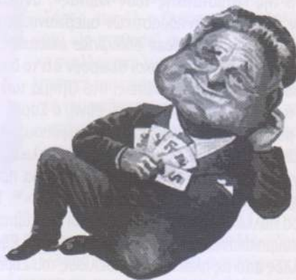
ΤΖΟΡΤΣ ΣΟΡΟΣ, ΤΟΥ JEFF WONG ΑΠΟ ΤΟ FINANCIAL WORLD

Στείλτε τα υψηλόβαθμα κυβερνητικά στελέχη των Η.Π.Α. να πιέσουν τις φιλικές Αραβικές και Μουσουλμανικές κυβερνήσεις ώστε όχι μόνον να καταδικάσουν δημόσια τις επιθέσεις της 11/09 αλλά και να στηρίξουν ενεργά τους σκοπούς της αντιτρομοκρατικής καμπάνιας των Η.Π.Α. Εάν οι κυβερνήσεις της Μέσης Ανατολής και της Νότι-