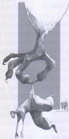
ANGEL BOLIGAN, EL UNIVERSAL, ΜΕΞΙΚΟ

από το NATO, ενώ υποστήριξε ακόμα και τη χερσαία εισβολή στην Γιουγκοσλαβία. Υπήρξε ιδρυτής και για πολλά χρόνια πρόεδρος των Δημοκρατών Σοσιαλιστών , μιας σημαντικής φιλελεύθερης αριστερής ομάδας των Η.Π.Α.