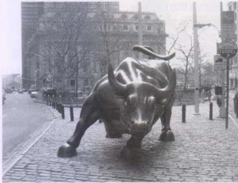
ΑΓΑΛΜΑ ΣΤΗΝ WALL STREET ΤΗΣ ΝΕΑΣ ΥΟΡΚΗΣ