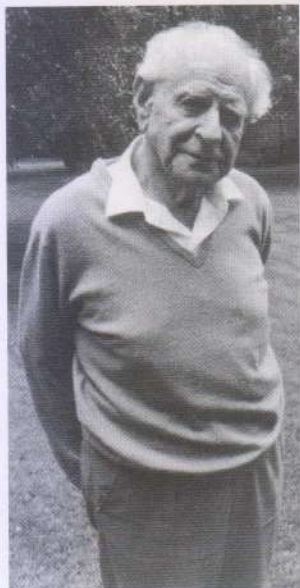
Ο ΚΑΡΛ ΠΟΠΠΕΡ

Έτσι λοιπόν, από άγνωστους ανθρώπους ή οργανισμούς όπως οι SEEP, COMIR, BAN, GHM, IFEX, ERRC , κ.λπ. και ο Florian Bieber , μέχρι μεγάλα ψάρια πώς οι ICG, HRW, IPWR , κ.λπ. και Λούις Άρμπορ, Μόρτον Αμπράμοβιτς ή Γουέσλεϊ Κλαρκ —για να αναφέρουμε κάποιους μόνο—η ατζέντα, η ιδεολογία και οι πηγές χρηματοδότησης είναι οι ίδιες. Προέρχονται από το Ίδρυμα Φορντ , το Εθνικό Ίδρυμα για τη Δημοκρατία των ΗΠΑ , το Ινστιτούτο για μια Ανοιχτή Κοινωνία και πολλούς, πολλούς πλούσιους οργανισμούς. Ο δε Τζωρτζ Σόρος βρίσκεται πάντα ανεξαιρέτως στο επίκεντρο αυτής της ομόκεντρης μάζας.