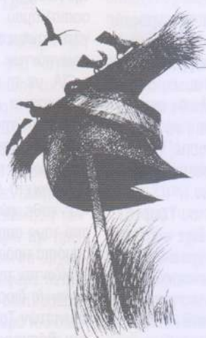
ANGEL BOLIGAN, EL UNIVERSAL, ΜΕΞΙΚΟ

Όταν ο Σόρος ίδρυσε το Ταμείο για την Ανοιχτή Κοινωνία , επέλεξε την Argye Neier για τη διευθυντική του θέση. Η Neier ήταν επικεφαλής του Παρατηρητηρίου του Ελσίνκι (Helsinki Watch), μια οργάνωση για τα Ανθρώπινα