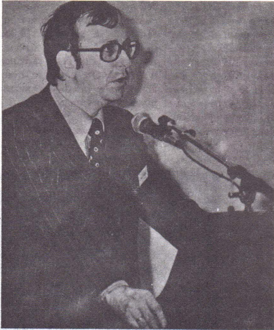
Άλαϊν ντέ Μπενουά

Ἡ «ΕΛΕΥΘΕΡΗ ΣΚΕΨΙΣ» ἐξασφάλισε κατά παγκόσμια ἀποκλειστικότητα γιὰ τὴν Ἑλληνικὴ γλῶσσα, τὸ πολύκροτο βιβλίο.