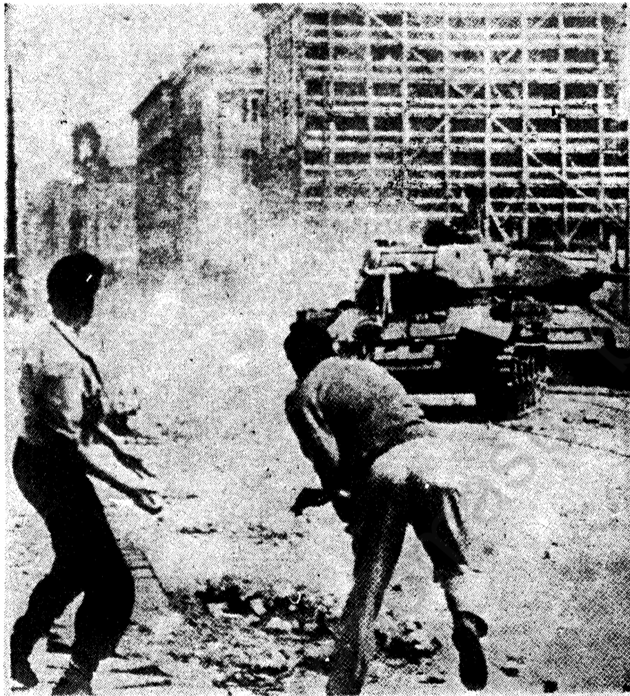
Ἡ χώρα τῶν Βαλκυ-ριῶν ἐναντίον τοῦ ἀ-σιατικοῦ κτήνους.

17 Ἰουνίου 1953. Ὁ ἐπα-ναστατήσας γερμανικὸς λαὸς λιθοβολεῖ τὰ ὄρματα τῶν Ρώσων. Ἔως τότε ἡ Εὐρώ-πη θὰ ὑποφέρει τὸ κνούτο;