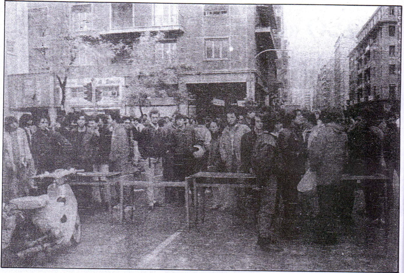
Όρισμένοι χαρακτηριστικοί τύποι «φοιτητών», κατά τη διάρκεια του κοψίματος της κυκλοφορίας στην Πατησίων.

νά τό κάνει αυτό, χρειάζεται πάνω απ' όλα επιστημονικό δυναμικό. Καί βέβαια, δέν πρόκειται ποτέ νά αντιμετώπισουμε μέ επάρκεια τόν 'Αμερικάνο, 'Ιάπωνα ή Γάλλο τεχνοκράτη, αν δέν στήσουμε ποιοτικά πανεπιστήμια. 'Αλλά ποιοτικά πανεπιστήμια δέν στήνονται χωρίς προσπάθεια, χωρίς θυσίες από όλους, χωρίς εργασία σκληρή, μέ δύο λόγια χωρίς εντατικοποίηση τών σπουδών. Κάτι πού τό σύνολο τών φοιτητικῶν παρατάξεων αρνείται.